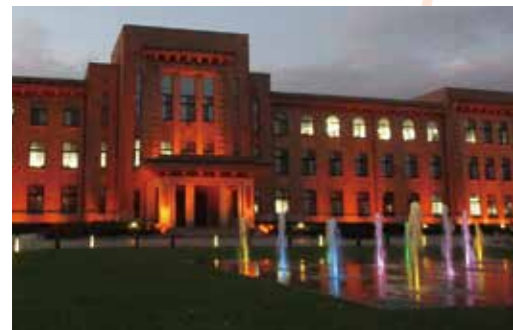
世界アルツハイマーデーの県庁ライトアップ