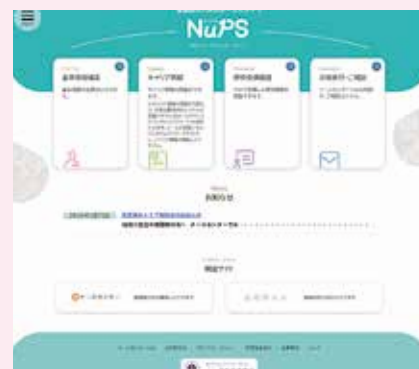
(左) NuPSスマートフォン表示時トップ画面、(右)同パソコン表示時トップ画面 ※画像はイメージです。実際のサイトとはデザイン・仕様が一部異なる場合がございます。

NuPSを活用することで、自身のキャリア情報が一元化でき、看護職としてのキャリア形成する上での支援やキャリア情報に基づいた就業支援を受けやすくなりますので、ぜひNuPSをご活用ください。