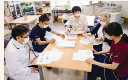
認知症疾患医療センター担当者会議

ん。むしろ、多くの方が今までできたことができなくなること自覚し、不安を抱きながらも精一杯生活しようとしています。スタッフには意思決定を支え、認知症の人のできていることは認め、できない事はどのように環境を整えたらできるようになるのか、それを考えるのが認知症ケアだと指導しています。認知症の人が成功体験を得ることで、自己効力感が高まりできる能力の維持、ひいては尊厳を保つことに繋がると思います。臨床現場では認定看護師として、実践を行いながらスタッフの持つ経験値に形式知を加えて認知症ケアのスキルを高められるように努めています。認知症の人が住み慣れた地域で再び生活できるようにスタッフと共に認知症の人を支えていきたいと思っています。