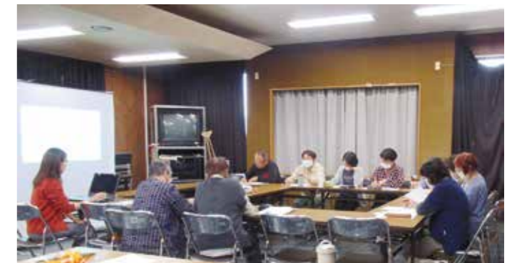
認知症サポーターステップアップ講座の活動

令和6年度高齢者福祉基礎調査より、本市の認知症高齢者の約9割が在宅で生活しています。認知症の人やその家族が地域で安心して過ごすためには、地域の誰もが認知症への誤解や偏見をなくし、身近な疾患として正しい理解を深め、見守りや助け合いを行うことができる地域をつくる必要があります。そこで本市では、認知症の人やその家族をあたたく見守る応援者である「認知症サポーター」の養成を積極的に行っています。最近、学童や高校など若年層に講座をする機会も増え、若いうちから認知症への偏見をなくし、身近に感じてもらうきっかけになればと思っています。地道な活動ですが、講座により認知症に対する見方が変わった等という声をいただくこともあり、やりがいを感じています。また、認知症サポーターを対象としたステップアップ講座を開催し、実際に支援活動を行うことができる認知症サポーターを育成するとともに、認知症の人やその家族の暮らしを支援する「チームオレンジ」の一員として活動できる人材の発掘に取り組んでいます。チームオレンジのメンバーの中には、80歳を超えてもなお積極的に活動してくれている方もいます。地域の方も巻き込みながら、「お互いさま」と見守ることができる地域を目指し、活動していきたいと思っています。