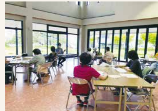
認知症カフェの研修会