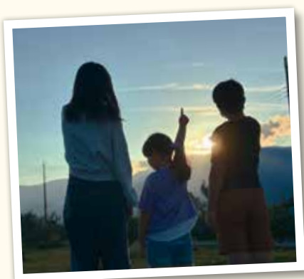
我が家の三きょうだい

子育てと仕事の両立は大変で悩むことも多いですが、子供たちの成長を楽しみに、また自分自身も親として、看護師として成長していけるよう頑張っていきたいと思っています。