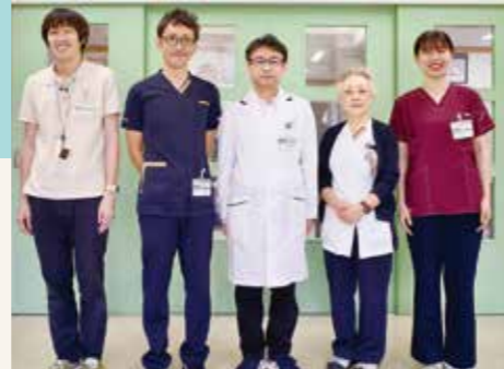
疾患医療センターメンバー

日下部記念病院は平成21年より認知症疾患医療センター地域型として指定され、山梨県東部を管轄していました。現在は山梨県内に4つの認知症疾患医療センターがあるため、峡東地域を管轄しています。認知症疾患医療センターはかかりつけ医、地域包括支援センター、介護・福祉施設と連携し、医療と介護が一体になって認知症患者とその家族を支援するという特徴を持っています。その中で、認知症看護認定看護師の役割としては「合併症/行動・心理症状への急性期対応」「かかりつけ医等への研修会の開催」があります。